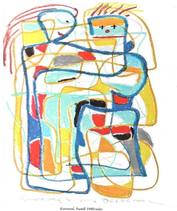
DELBLANC: KARNEVAL – PASTELL FRÅN 1980-TALET