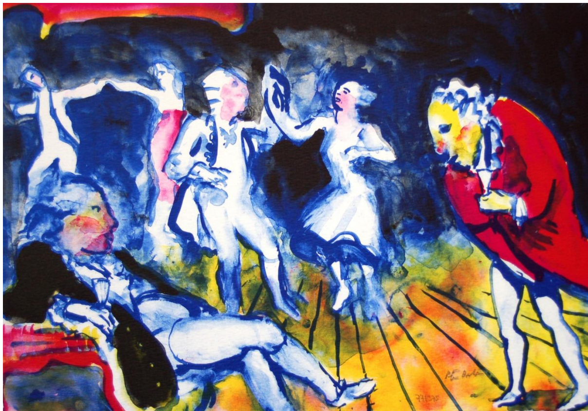
Ur MINNESBILDER FRÅN FREDMANS EPISTLAR av Peter Dahl