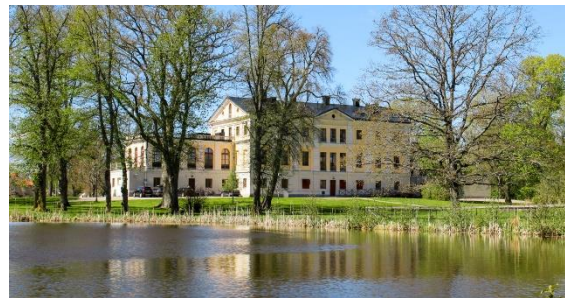
Det nyrestaurerade Säfstaholms slott

Kvar att bese i Vingåker finns emellertid Säfstaholms slott med det berömda äpplets urmoder vid liv och en fin bit svensk historia, en ovanligt bra lunchrestaurang samt ett jättestort Factory Outlet med ’halva priser’. Kanske kan vi i egen buss också åka förbi seriens Valla herrgård? Annars är orten lättåtkomlig med tåg. Tyvärr är projektet f.t. vilande på grund av sjukdom – men vi ser tiden an.